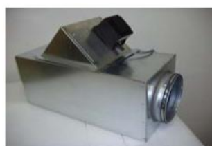
Monteringslåda med kanalpåslag

Torpa Ventilation, Box 3011 ,550 03, Jönköping. Tel: 036-36 85 45