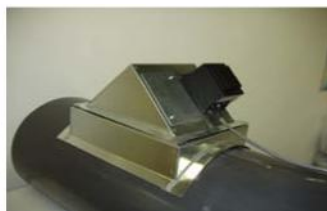
Montagedetalj för rundkanal med kanalpåslag